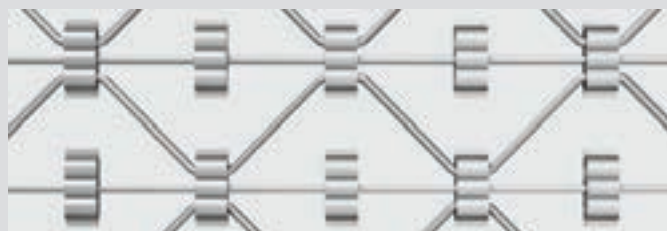
ProTect Plus (Zusatzclips)

Als Ausführung ProTect Plus mit einem zusätzlichen Verbindungselement in der Wabe eignet sich das Gitter auch für Schaufenster mit höheren Sicherheitsanforderungen wie z. B. Juweliere.