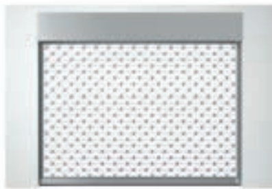
Einbauvariante mit Sturzblende