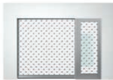
Einbauvariante mit Nebentür