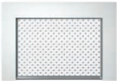
Einbauvariante hinter der Laibung