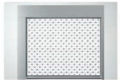
Einbauvariante zw. der Laibung